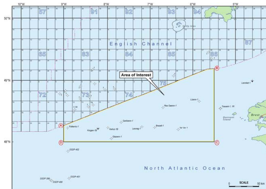
Figure 1: Carte montrant le périmètre sollicité

GTO Limited pense qu'il est nécessaire d'effectuer une ré-évaluation complète de la zone en utilisant les techniques modernes d'exploration pour mettre à jour de l'analyse des systèmes pétroliers du bassin, définir le positionnement des "plays", les risques et évaluer les concepts de "plays" pour encourager plus avant l'exploration avec de nouvelles méthodes d'acquisition sismiques, puis éventuellement effectuer un ou plusieurs forages.